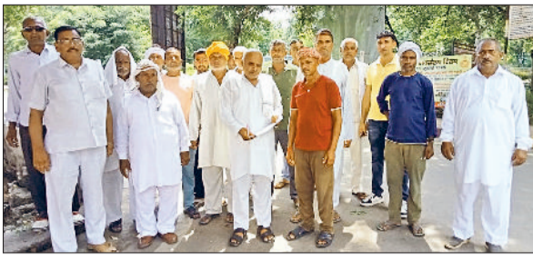
भिवानी। उपायुक्त से मिलने जाते गांव चांग के किसान।

मेरी फसल मेरा बीमा योजना में गांव चांग का नाम शामिल करने की मांग रखी